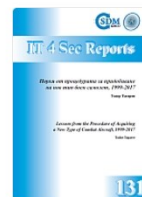
IT4Sec Reports ISSN: 1314-5614