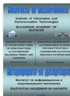
Аutoreферати на дисертации e-ISSN: 1314-6351