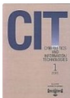
Cybernetics and Information Technologies p-ISSN: 1311-9702; e-ISSN: 1314-4081